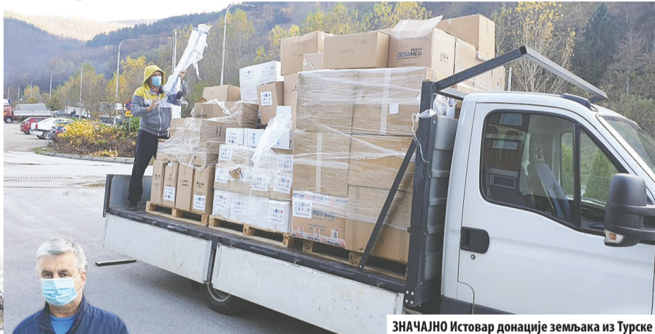
ЗНАЧАЈНО Истовар донације земљака из Турске

Помоћ је стигла у прави час. Ситуација је изузетно тешка, али можемо рећи да је и даље под контролом. Добили смо помоћ у потрошном и изузетно важном материјалу наглашава за-